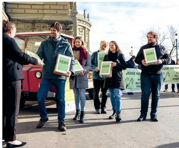
Remise de la pétition « Chaque ferme compte » à la Chancellerie fédérale en novembre 2022.

Notre système alimentaire (trop) sensible aux crises a fortement influencé le débat politique en 2022. Après le Covid-19, la guerre en Ukraine et la crise énergétique qui en résulte ont une fois de plus mis en évidence les points faibles du système agricole et alimentaire mondial. Avec son rapport en réponse aux postulats sur l'orientation future de la politique agricole, le Conseil fédéral a donné d'importantes réponses sur la direction que doit prendre la politique agricole. Une majorité est favorable à cette perspective d'avenir du Conseil fédéral. Cela devient plus controversé lorsqu'il s'agit de définir les étapes concrètes de cette vision d'avenir. C'est ce qu'ont montré, en particulier, les discussions autour de la Politique agricole 22+ dans laquelle toute mesure en faveur d'une agriculture plus respectueuse du climat, de la biodiversité et du bien-être animal a été rejetée par une majorité du Parlement. L'introduction d'une assurance récolte cofinancée par l'État est un exemple du manque de sérieux avec lequel les défis sont abordés. Une majorité de parlementaires mise sur la lutte contre les symptômes