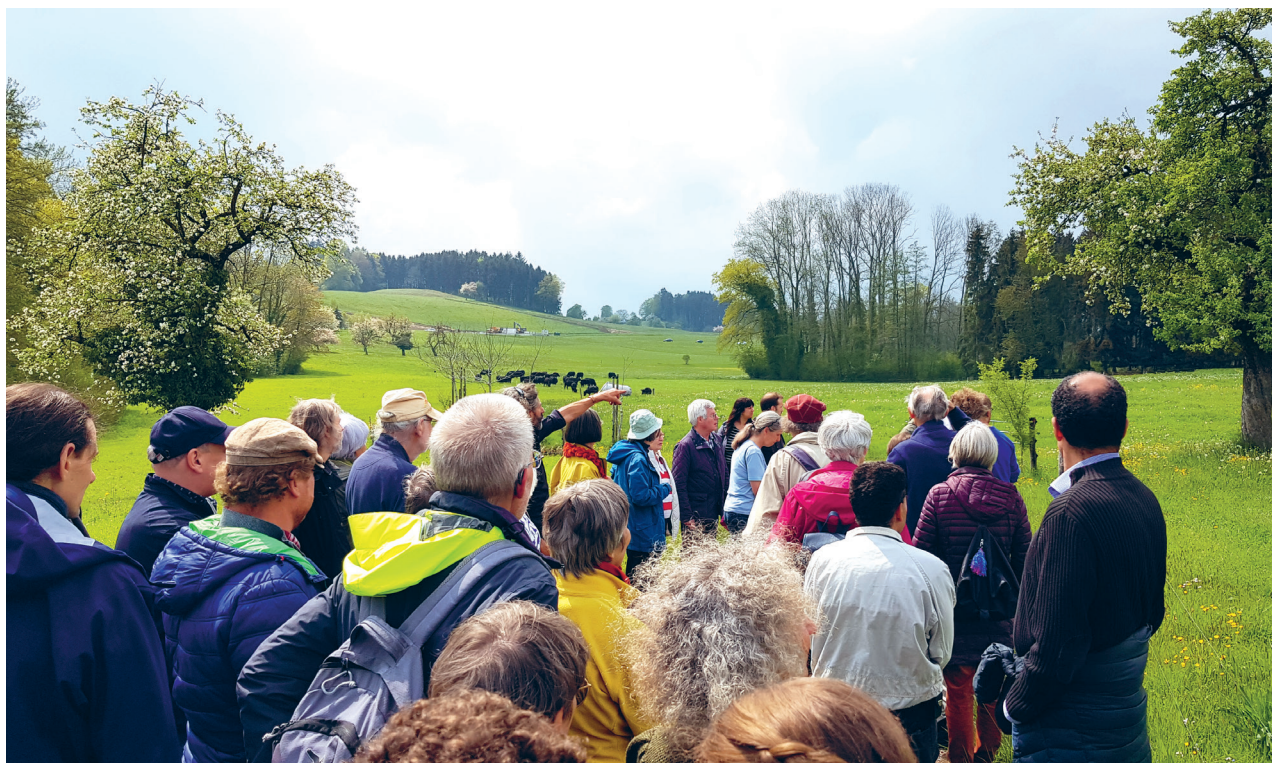
Visite guidée de la ferme biologique Enderlin, dans le canton de Thurgovie, lors de l'Assemblée générale 2022.

médias sociaux, la croissance est la plus forte. À ce jour, 506 personnes nous y suivent (+48% par rapport à l'an dernier).