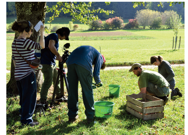
En scène pour la transmission de fermes

Bien que notre communauté en ligne devienne de plus en plus importante, l'Association des petits paysans tient à participer à divers marchés afin de main-